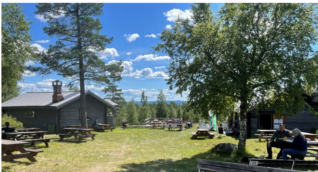
Lejsme Pers stuga, Rihimäki, Malungs finnmark