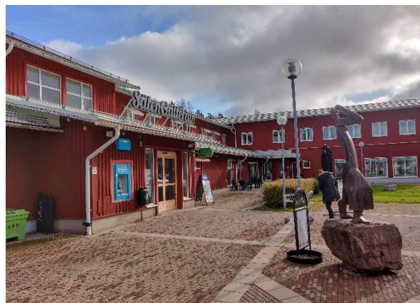
Sälens Gallerian i Sälens by.