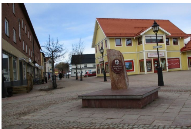
Gågatan i centrala Malung.

Denna serviceplan ska gälla under perioden 2024–2027 men är öppen för revideringar utifrån vad som sker på landsbygden under perioden.