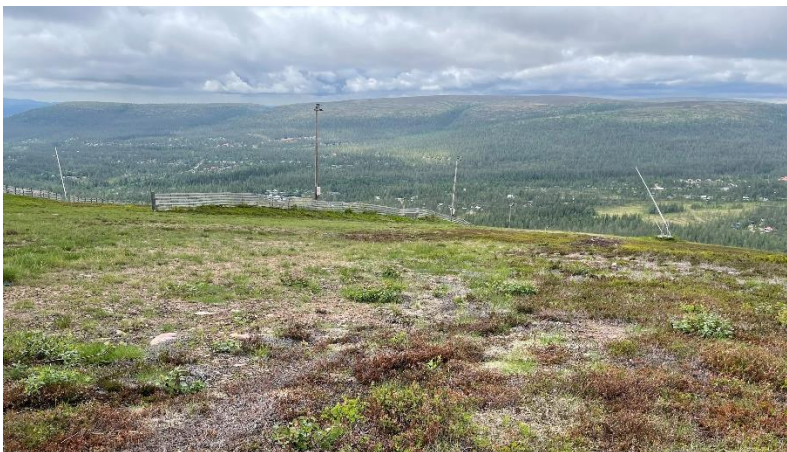
Vy från Västra Kalven mot Orrliden/Myrflodammen.

Kommunens naturvårshandläggare har gjort en översiktlig bedömning av naturvärdena vid ett platsbesök den 2 november 2021. Vid platsbesöket kunde det konstateras att inga naturvärden finns i det tänkta området.