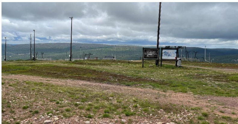
Vy från liften Mio express toppstation. Parliften till vänster och Norrliften till höger i bild.

Genom den strategiska placeringen kommer ett stort antal personer, såväl utförs- som turåkare, att få tillgång till toppstugan.