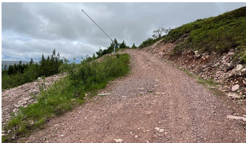
Övre delen av befintlig transportväg.

Planområdet nås via liftsystemen i första hand från Tandådalsanläggningen. Det kan även nås med snöskoter och pistmaskiner samt med andra terränggående fordon via en befintlig terrängväg som löper från Grå byn i Tandådalen och upp till toppen på Västra Kalven. Under vintertid är vägen pistad. Varutransporter till och från toppstugan avses ske med terränggående fordon såsom skoter och snö vessla samt även liftar. Terrängfordon kan under byggtiden nyttja vägen för transporter av byggmaterial. Förutsättningar saknas för att ordna en för bilar körbar väg.