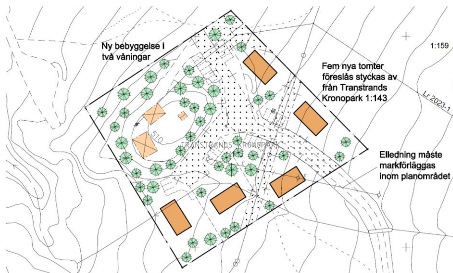
Utdrag ur plankartan