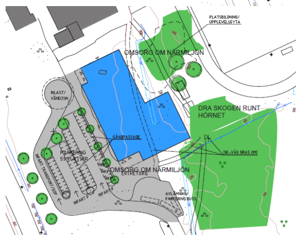
Utdrag ur plankarta & illustrationsplan