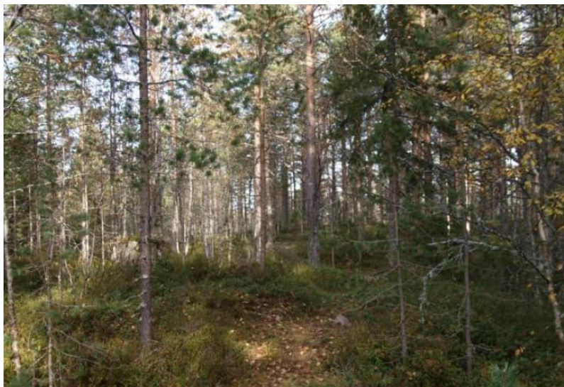
Tallskogen inom området. HL Taigabas

Områden som föreslås tas i anspråk för ny bebyggelse inrymmer enligt naturvärdesinventeringen inga utpekade naturvärden.