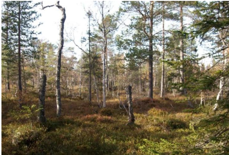
Tallsumpskogen inom området. HL Taigabas