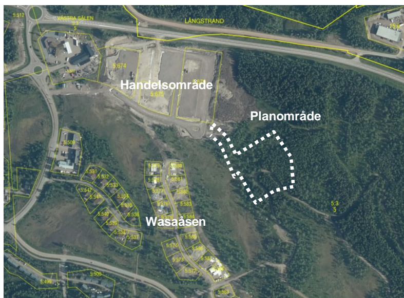
Översiktskarta, källa lantmäteriets karttjänst Kartsök och ortsnamn

Planområdet är beläget cirka 100 meter sydost om det nya handelscenter som är under utbyggnad i Lindvallen. Ca 600 meter sydväst om planområdet ligger Experium-torget. Det föreslagna planområdet ligger utanför detaljplanelagt område. Planområdet omges av skogs- och myrmark och i söder finns skidspår som ingår i ett större spårssystem. Cirka 100 meter väster om planområdet ligger tomtområdet Wasaåsen.